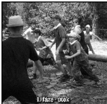
1. fáze - útok