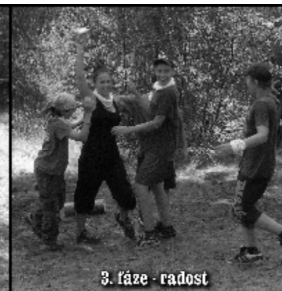
3. fáze - radost